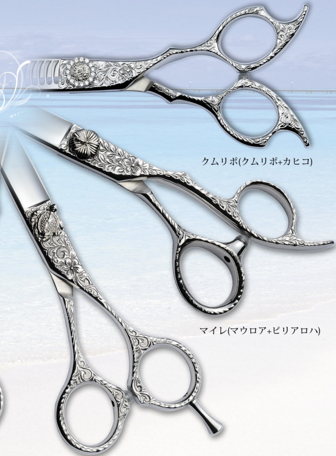
クムリボ(クムリボ+カヒコ)