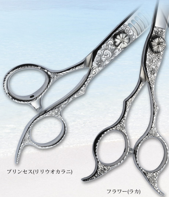
プリンセス(リリオオカラニ)